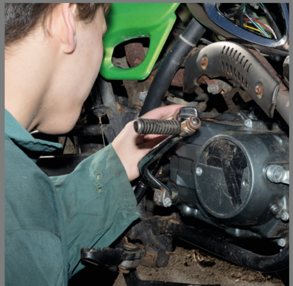
Diese „Impulsbilder“ entstammen der „Kompetenzbilanz“ der Düsseldorfer Potenzialanalyse. (Vodafone Stiftung Deutschland gGmbH (Hrsg.) (2017): Düsseldorfer Potenzialanalyse. Eine migrationssensible Weiterentwicklung der Düsseldorfer Potenzialanalyse entwickelt im Rahmen eines Kooperationsprojekts der Fachhochschule des Mittelstands, der Landeshauptstadt Düsseldorf und der Vodafone Stiftung Deutschland. Düsseldorf.)