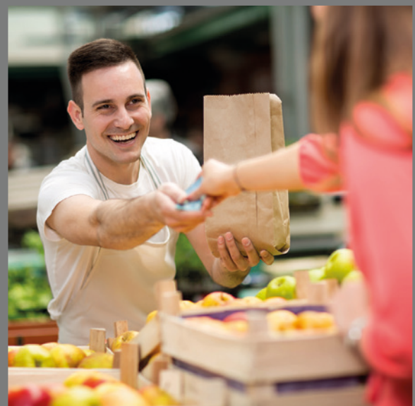
Diese „Impulsbilder“ entstammen der „Kompetenzbilanz“ der Düsseldorfer Potenzialanalyse. (Vodafone Stiftung Deutschland gGmbH (Hrsg.) (2017): Düsseldorfer Potenzialanalyse. Eine migrationssensible Weiterentwicklung der Düsseldorfer Potenzialanalyse entwickelt im Rahmen eines Kooperationsprojekts der Fachhochschule des Mittelstands, der Landeshauptstadt Düsseldorf und der Vodafone Stiftung Deutschland. Düsseldorf.)